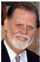
Hackford, Taylor (1944-....)