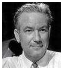
Fleming, Victor (1883-1949)

Autant en emporte le vent [Film] = Gone with the Wind /