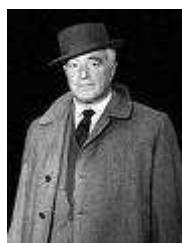
De Sica, Vittorio (1901-1974)

Le voleur de bicyclette [Film] = Ladri di biciclette /