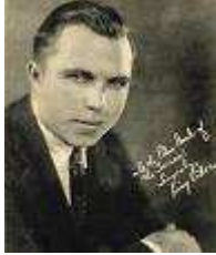
Vidor, King (1894-1982)

Le rebelle [film] = The Fountainhead / King Vidor, réalisateur ; Ayn Rand, scénario ; Max Steiner, musique ; Gary Cooper, Patricia Neal, Raymond Massey, acteurs ... [et al.] Neuilly Sur Seine : Warner Home Video, 2008. -- DVD (108 mn) : noir et blanc Film sorti aux Etats-Unis en 1948. -- Version anglaise sous-titrée en français. –