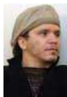
Dahan, Olivier (1967-....)