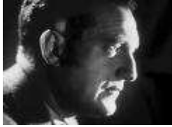
Grémillon, Jean (1901-1959)

Remorques [Film] / Jean Grémillon, réalisateur ; Jacques Prévert, scénario ; Roland Manuel, musique ; Jean Gabin, Michèle Morgan, Madeleine Renaud, acteurs Mk2, C 2009. -- 1 DVD (79 mn) : noir & blanc Sorti en 1941, France. –