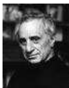
Kazan, Elia (1909-2003)

A l'est d'Eden [film] = East of Eden / Elia Kazan, réalisateur ; d'après le roman de John Steinbeck ; Paul Osborn, scénario ; Léonard Rosenman, musique ; James Dean, Julie Harris, Raymond Massey, acteurs ... [et al.]