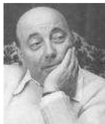
Carné, Marcel (1906-1996)

Drôle de drame [Film] / Marcel Carné, réalisateur ; Jacques Prévert, scénario ; Louis Jouvet, Michel Simon, Françoise Rosay, acteur ... [et al.] Editions Montparnasse, C 2000. -- DVD (109 mn) : noir & blanc Sorti en 193, France. –