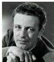
Ray, Nicholas (1911-1979). pseud.

La fureur de vivre [film] = Rebel without a cause /