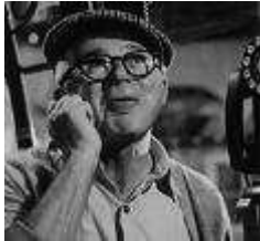
Wilder, Billy (1906-2002)

Howard Roark, jeune architecte idéaliste préfère travailler dans une carrière de pierres plutôt que d'être corrompu puis finit par être reconnu après avoir été embauché par l'architecte Henry Cameron. Alors qu'il reçoit une commande du patron d'un journal, il retrouve Dominique, ancien amour à présent mariée à son commanditaire.