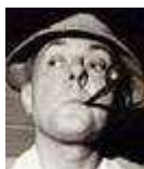
Tati, Jacques (1907-1982). pseud.

Mon oncle ; My uncle [film] / Jacques Tati, réalisateur,