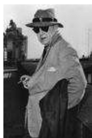
Ford, John (1894-1973). pseud.

Les Raisins de la colère [Film] = The grapes of wrath /