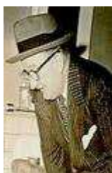
Seiter, William A. (1890-1964)

Panique à l'hôtel [film] / William A. Seiter, réalisateur ;