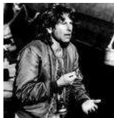
Polanski, Roman (1933-....)

Le bal des vampires [film] = The fearless vampire killers/