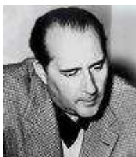
Rossellini, Roberto (1906-1977)

Viaggio in Italia [film] = Voyage en Italie /