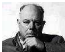
Renoir, Jean (1894-1979)